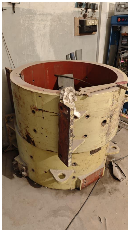
Фото 5. Электр кыймылдаткычтын статорлору