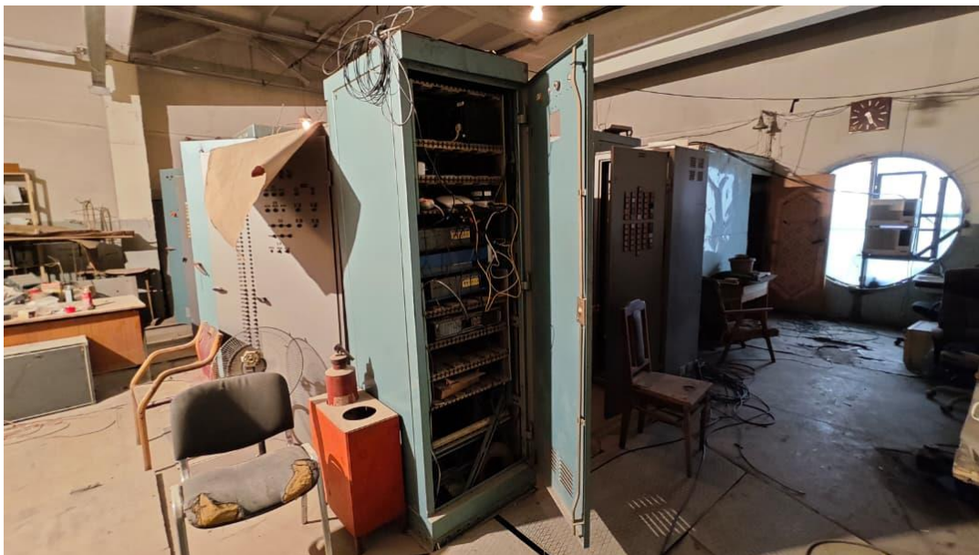
Фото 1. Башкаруу шкафы