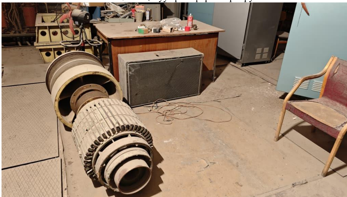
Фото 4. Электр кыймылдаткычтын ротору