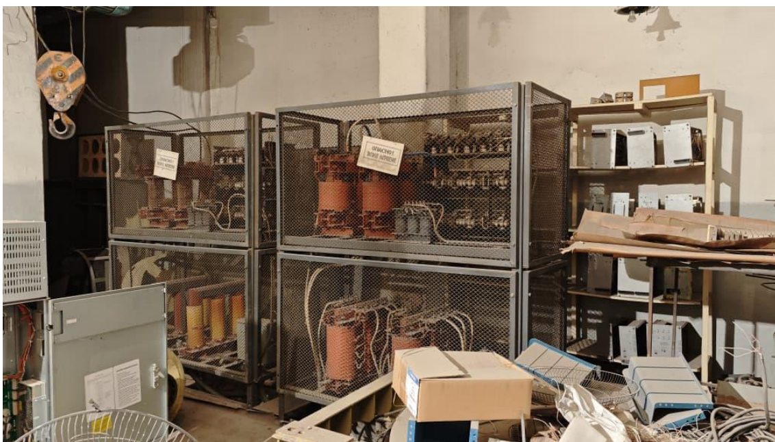
Фото 3. Чыңалуу трансформаторлору